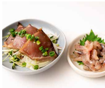
藁焼きかつおのたたきと あじのなめろう