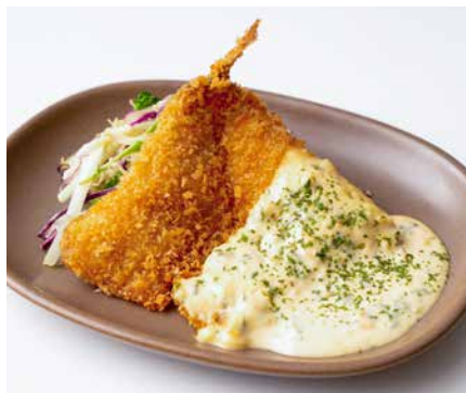
たっぷりタルタルの アジフライ