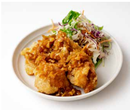
鶏の唐揚げ油淋鶏ソース