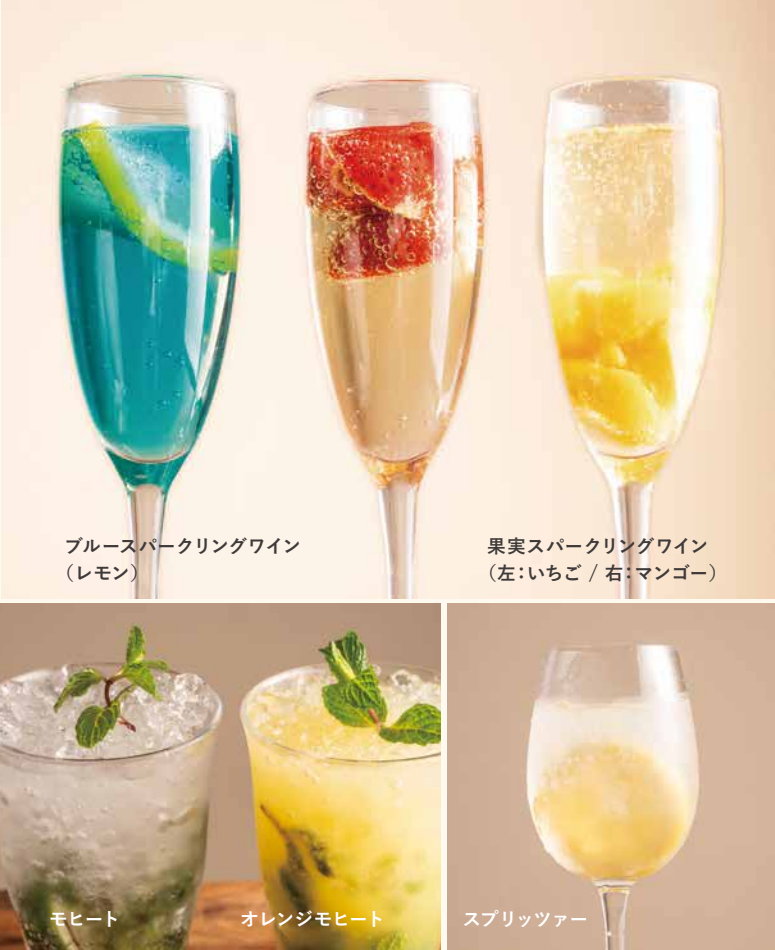
ブルースパークリングワイン (レモン)