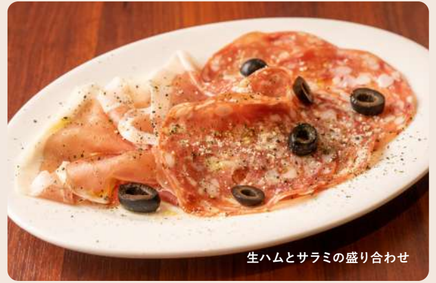
生ハムとサラミの盛り合わせ