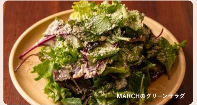
MARCHのグリーンサラダ