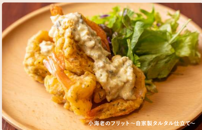
小海老のフリット～自家製タルタル仕立て～