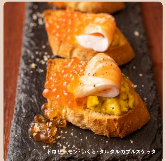
トロサーモン・いくら・タルタルのブルスケッタ