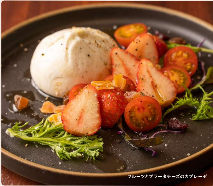
フルーツとブラータチーズのカプレーゼ