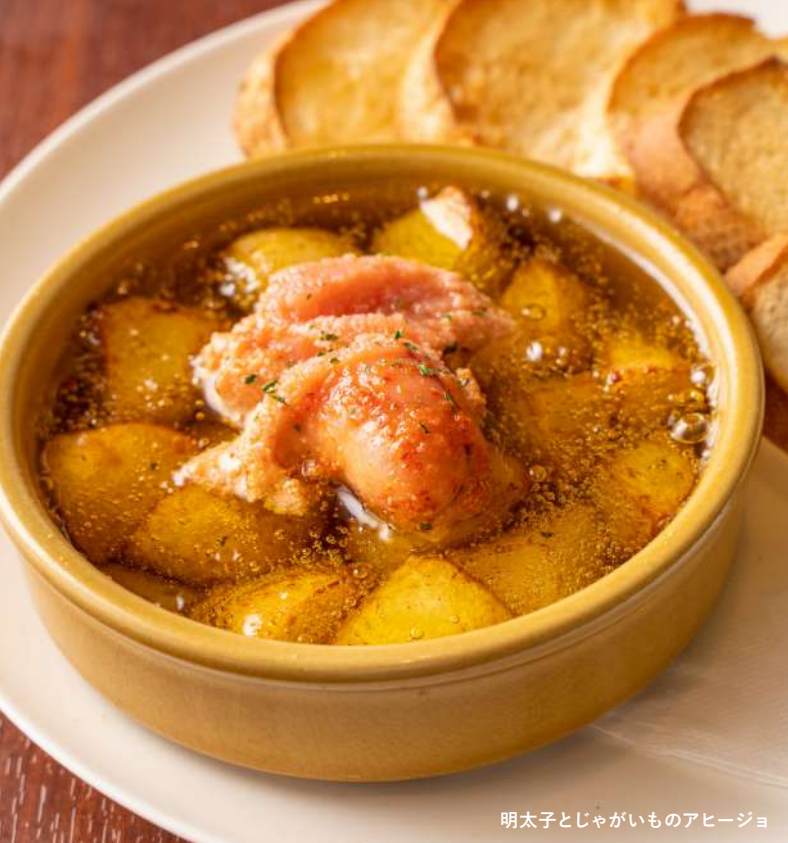
明太子とじゃがいものアヒージョ