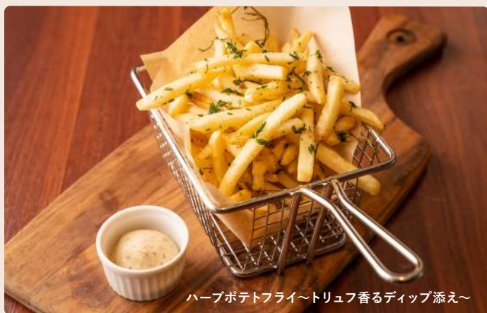
ハーブポテトフライ～トリュフ香るディップ添え～